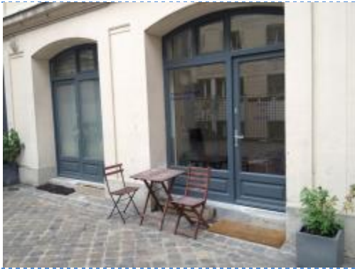
Entrée de la salle d'attente et table extérieure

LOYER 950€ Charges comprises, dont : électricité/chauffage(60€), eau/charge de l'immeuble(50€), wifi(15€), ménage(15€), assurance(12€).