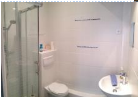
Toilettes et douche communes